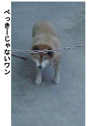
べっきーじゃないワン

びゃっきーが4か月連続で出演するKAZTOUライブ第2回が2月4日(土)午後6時20分から東高円寺ライブハウスKAZTOUで行われる。3か月以上連続で出演するとKAZTOUのホームページでは特集を組んでくれるのだが、そこに書かれた内容はあまりにびゃっきーにとって衝撃的(刺激的?)なものだった。